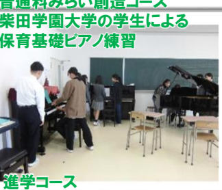
普通科みらい創造コース 柴田学園大学の学生による 保育基礎ピアノ練習