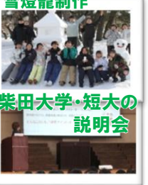
柴田大学・短大の 説明会