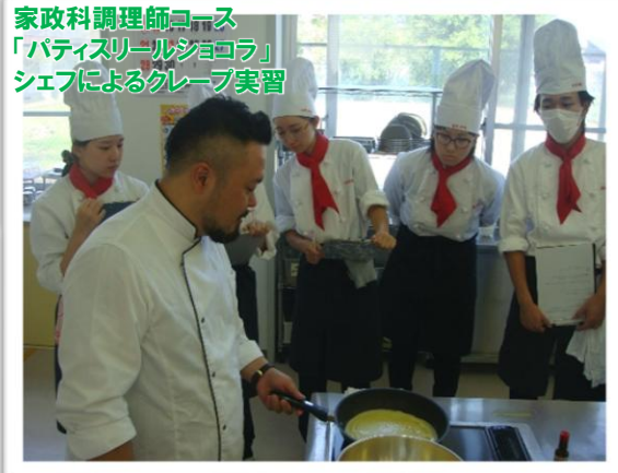
家政科調理師コース 「パティスリーリアルショコラ」 シェフによるクレープ実習