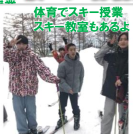
体育でスキー授業 スキー教室もあるよ