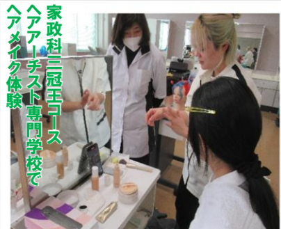
家政科三冠王コース ヘアメイク体験