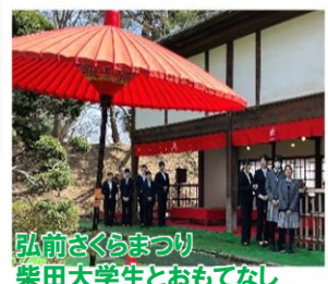
弘前さくらまつり 柴田大学生とおもてなし