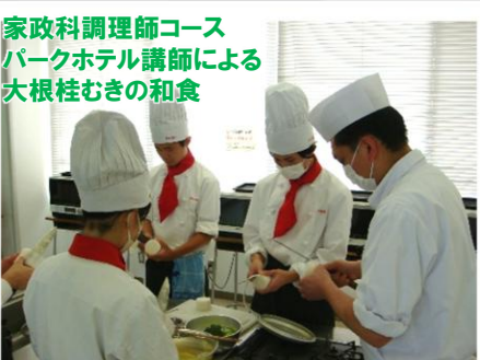
家政科調理師コース パークホテル講師による 大根桂むきの和食