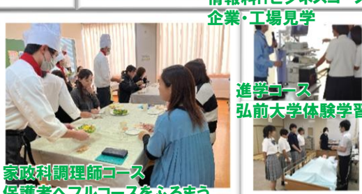
家政科調理師コース 保護者へフルコースをふるまう