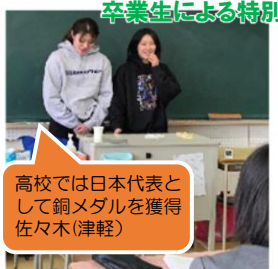
卒業生による特別授業