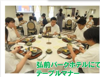
弘前パークホテルにて テーブルマナー